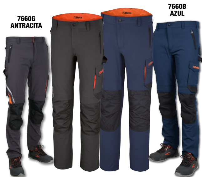
7660G ANTRACITA 7660B AZUL