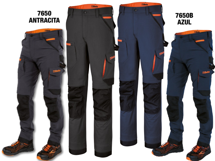
7650 ANTRACITA 7650B AZUL